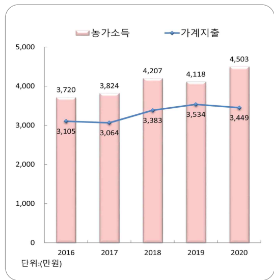
< 농가의 평균 소득 및 가계지출 >

2020년말 기준 농가의 평균자산 은 5억 6,562만원으로 전년대비 6.8% 증가, 평균부채 는 3,759만원으로 전년대비 5.2% 증가