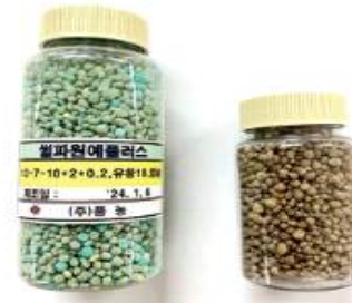
풍농은 시비분별성을 높이기 위해 셀파원에플러스의 모든 입자를 색상화했다. 좌측이 셀파원에플러스.

3~6% 수준이지만 ‘셀파원에플러스’의 유허 함유량은 무려 18%에 달한다. 그래서 별도의 유허 비료를 시비하지 않은 채 ‘셀파원에플러스’만 사용하면 된다. 이는 노동력과 비용 절감 등 농가 경영비 절감으로 이어질 수 있다.