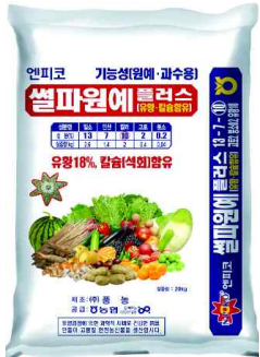
풍농이 선보인 프리미엄 기능성 비료, ‘셀파원에플러스’

- ‘셀파원에플러스’, 별도 유허 비료 시비 필요 없어, 노동력·비용 절감 등 효과적