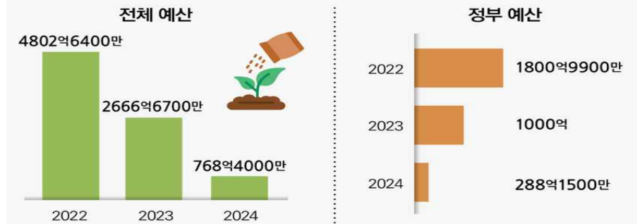
무기질비료 가격보조 및 수급안정 지원사업 예산(단위: 원)

비료업계에 따르면 무기질비료의 원료가격이 급등하자 식량안보를 확보하고 농업인의 경영부담을 낮추기 위해 정부는 무기질비료 가격보조 및 수급안정 지원 사업을 통해 2022년부터 무기질비료 구입비를 한시적으로 지원하고 있다.